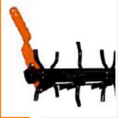
Rullo Spuntoni | Spike Roller Rouleau à dents | Zinkenwalze

Meccanico | Mechanical Mecanique | Mechanisch