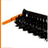
Rullo Packer | Packer Roller Rouleau Packer | Packer Walze

Meccanico | Mechanical Mecanique | Mechanisch