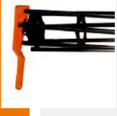
Rullo Gabbia | Cage Roller Rouleau barre | Stabwalze

Meccanico | Mechanical Mecanique | Mechanisch